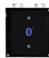
9155046 Lettore Bluetooth