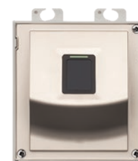
9155045 Lettore di impronte digitali