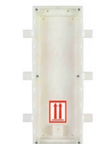
9155013 Alloggiamento a incasso Verso 3 moduli