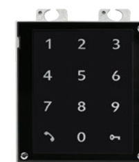
9155047 Tastiera a sfioramento