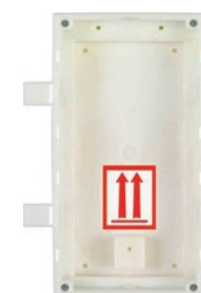
9155015 Alloggiamento a incasso Verso 2 moduli