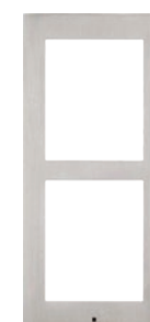
9155022 Cornice per l'installazione a filo, 2 moduli Dimensioni (L x A): 106.5 x 234,1 mm