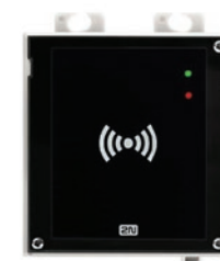
9155082 Lettore Bluetooth e RFID 125 KHz, 13,56 MHz, NFC

Disponibile anche in versione nera, può includere diversi moduli: lettore RFID, lettore Bluetooth, touch screen con elenco a scorrimento dei contatti, lettore biometrico, ecc.