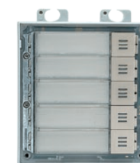
9155035 5 tasti