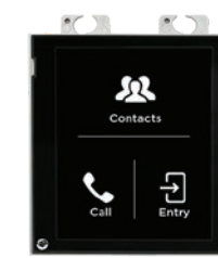
9155036 Touch screen