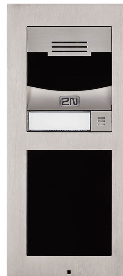
Kit composto da: 9155101C, 9155012, 9155015